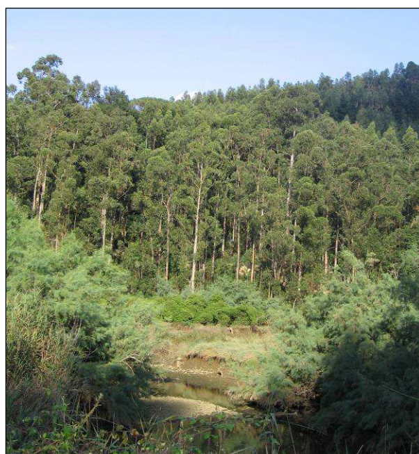
Imagen 6. Detalle de zona de eliminación (nueva actuación) de Baccharis halimifolia . Fotografías tomadas junto a la depuradora de Lekeitio.

Atendiendo a lo dispuesto en la Directiva 92/43/CEE, de 21 de mayo y de la Directiva 97/62/CE, de 27 de octubre, se ha analizado la cartografía disponible en la Web www.geo.euskadi.net , en materia de hábitats de interés comunitario y prioritario presente en la zona de estudio. El hábitat cartografiado en la zona sobre la que se va a actuar es el que se detalla en la siguiente tabla: