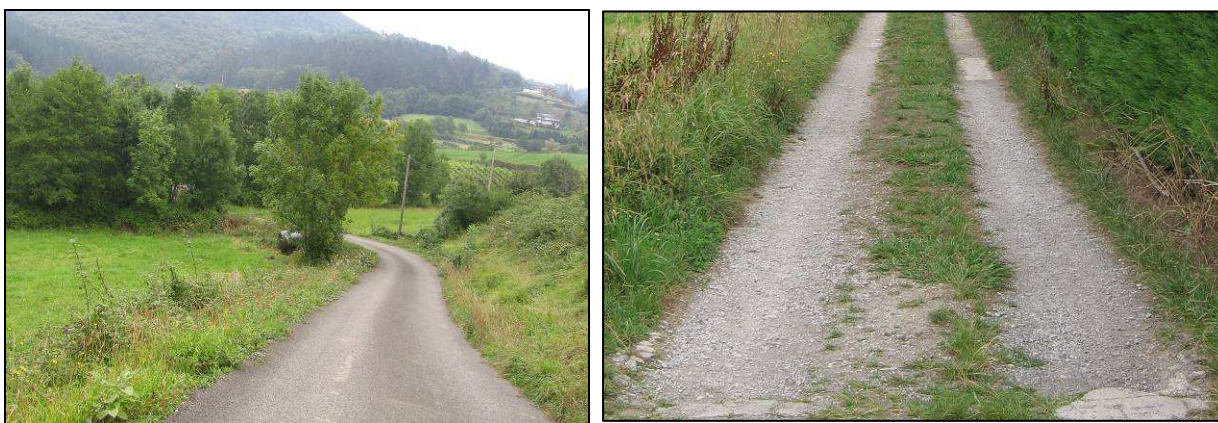
Imagen 8. Detalle de caminos de acceso a zonas de aplicación del producto

En las fotografías se aprecian dos zonas diferenciadas de estacionamiento de vehículos, estando la primera de ellas correctamente pavimentada y la segunda incorrectamente pavimentada, de cara a una posible manipulación del producto.