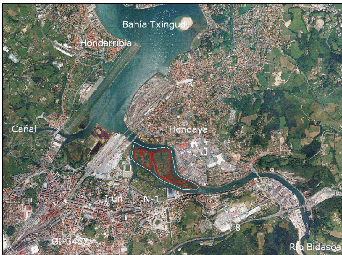
Imagen 3: Área de estudio de Txingudi.

Se describen a continuación las características más relevantes del medio en el que se ubican las instalaciones.