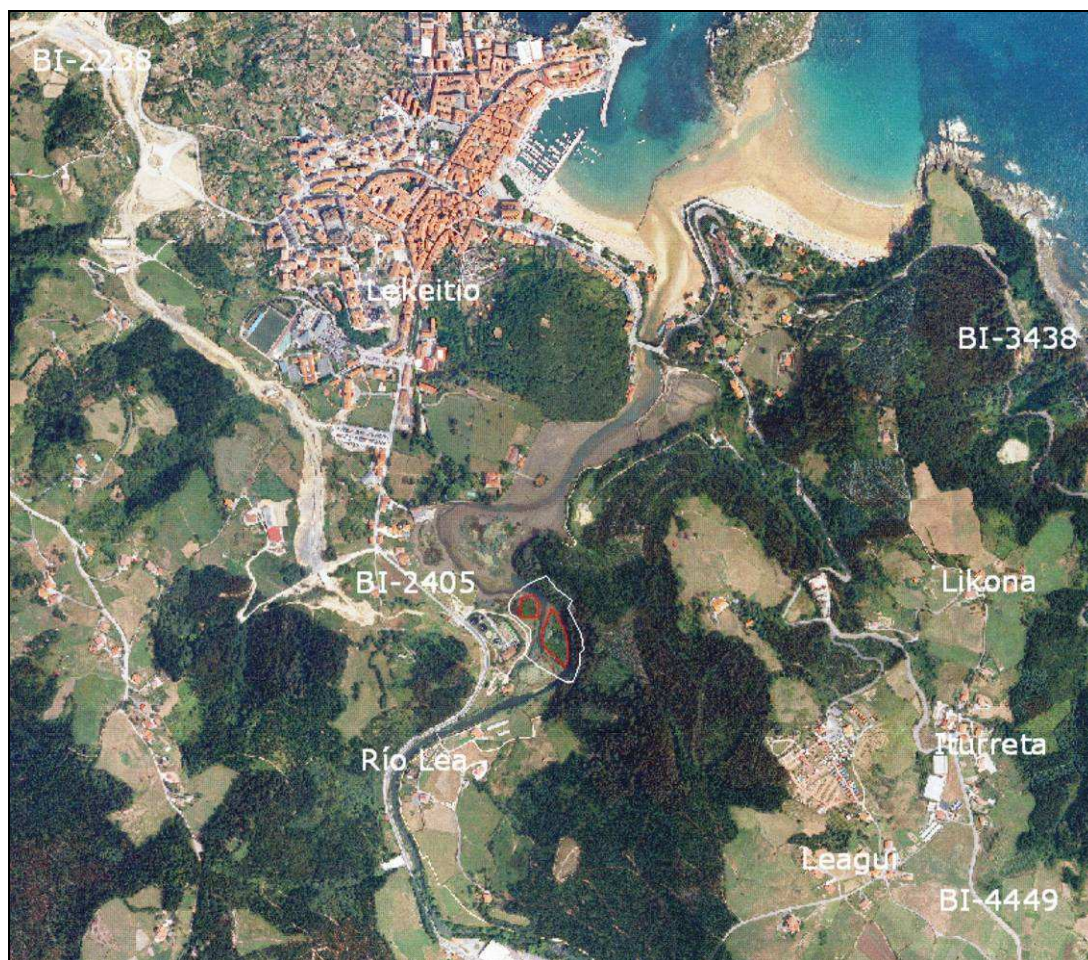
Imagen 2: Área de estudio de Lea.

El área Txingudi se localiza en el territorio histórico de Gipuzkoa, concretamente sobre las islas Galera y Santiagourra del río Bidasoa a la altura de Irún-Hendaya, en su desembocadura en la bahía de Txingudi, fronterizas con Francia. La superficie de actuación es de unas 5 has., todas ellas en territorio español; el único acceso a estas islas es un embarcadero en el margen izquierdo del Bidasoa.