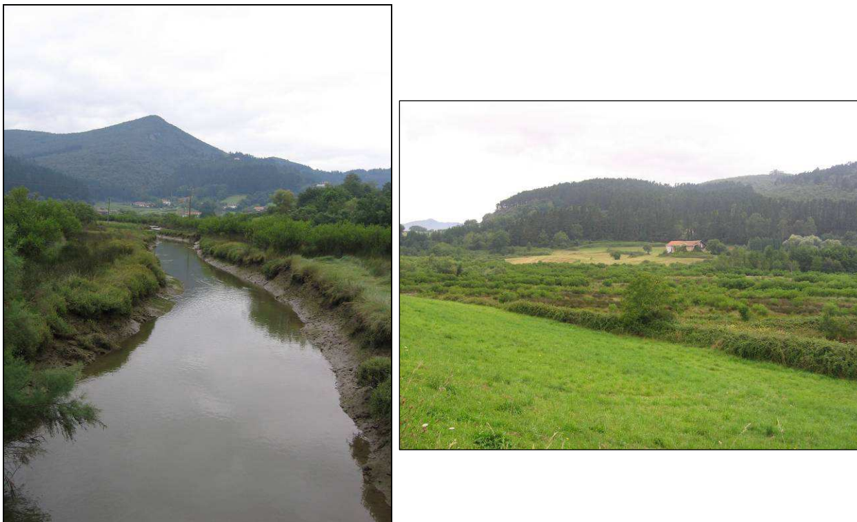
Imagen 5. Detalle de acequia próxima a la ría (izquierda) y de una zona de eliminación (nueva actuación) de Baccharis halimifolia ( derecha ). Fotografías tomadas próximas al Caserío Ozollo.

Atendiendo a lo dispuesto en la Directiva 92/43/CEE, de 21 de mayo y de la Directiva 97/62/CE, de 27 de octubre, se ha analizado la cartografía disponible en la Web www.geo.euskadi.net , en materia de hábitats de interés comunitario y prioritario presente en la zona de estudio. Los hábitats cartografiados en la zona sobre la que se va a actuar son los que se detallan a continuación.