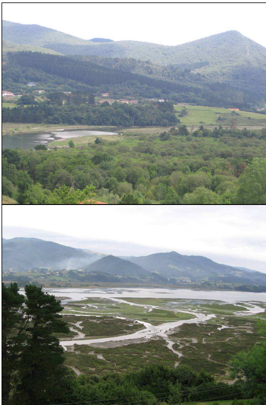
Imagen 4. Panorámicas de la marisma de Urdaibai tomada desde Murueta (fotografía superior) y Ozarniz (fotografía inferior).

Como especies características, bien por su rareza, bien por su estatus de conservación destacan Armeria euskadiensis , especie endémica del País Vasco, Lavatera arborea , Matricaria marítima , especie en peligro de extinción, cuya única población en el País Vasco se encuentra en el estuario de Urdaibai, Medicago marina y la ya citada Zostera noltii .