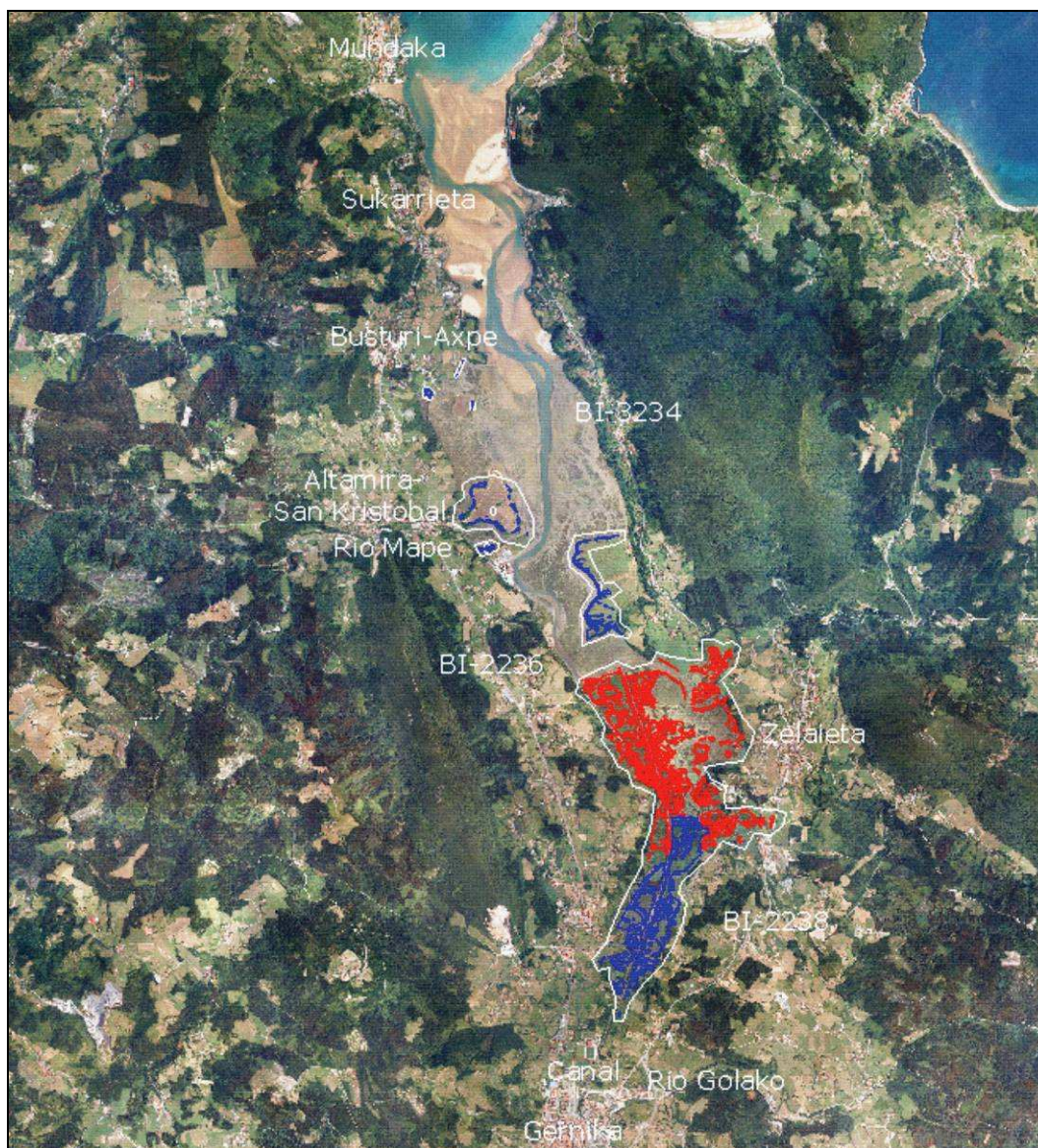
Imagen 1: Área de estudio de Urdaibai.

El área Lea se encuentra también en Bizkaia, enclavada en un meandro de la cola del estuario del río Lea que se encuentra en territorio de los municipios de Mendexa e Ispaster. El área donde se actuará abarca 0,5 has.