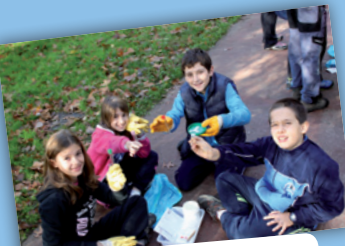
Créditos para universitarios/as.

Programa científico Dirigido a centros de Educación Secundaria y de formación, universitarios/as, asociaciones y participantes a título individual.