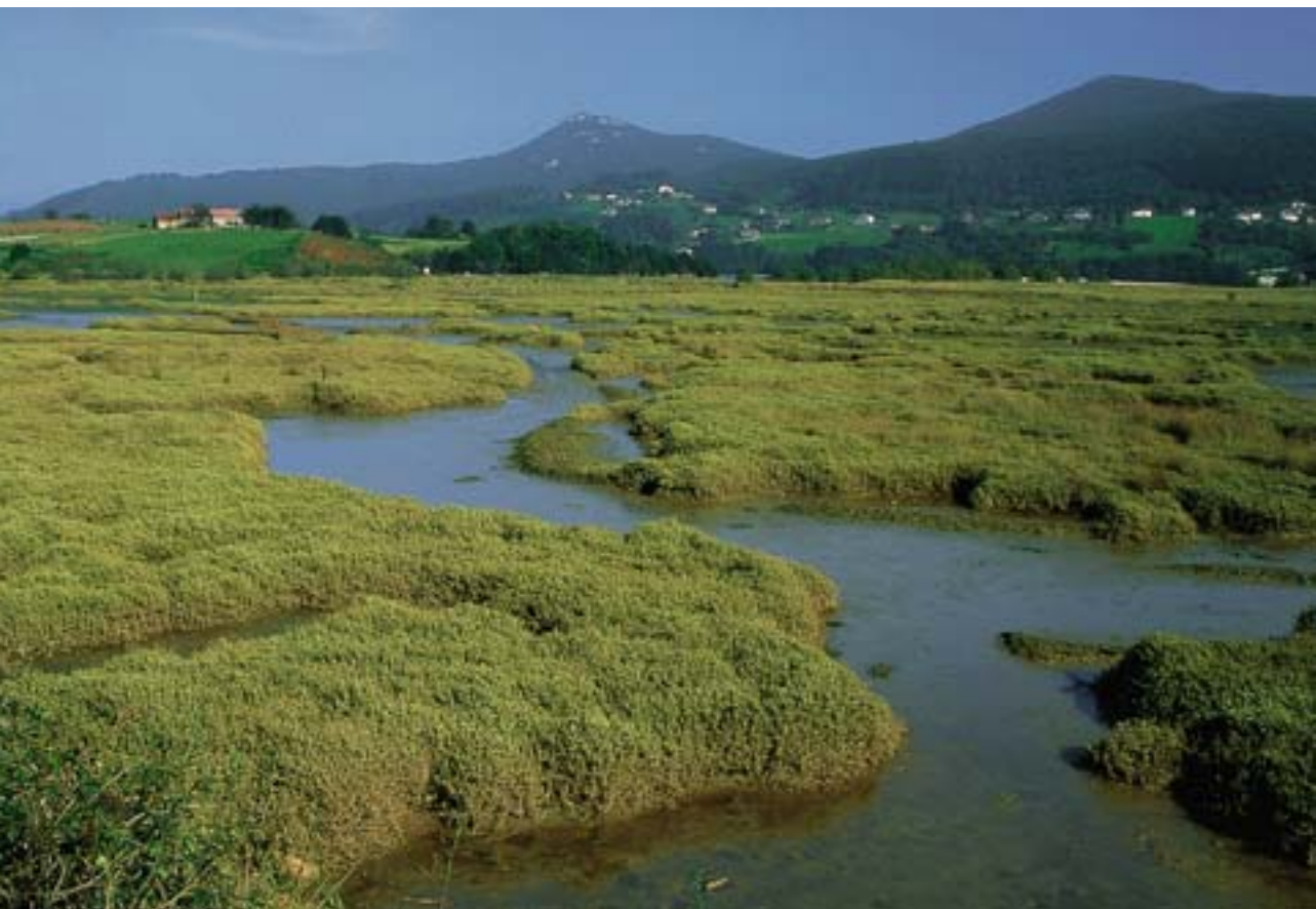
⚡ Padura Axpe/La marisma en Axpe ⇒ Txirri Arrunta bainua hartzen/Correlimos Común bañándose