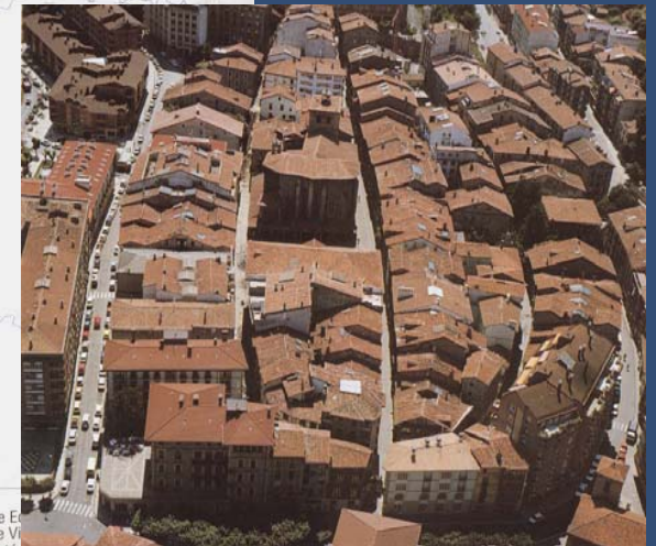
Cascos Históricos en el País Vasco